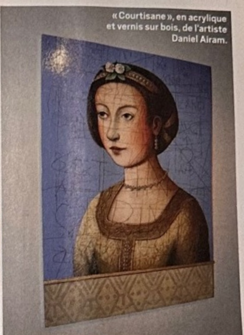
« Courtisane », en acrylique et vernis sur bois, de l'artiste Daniel Airam.