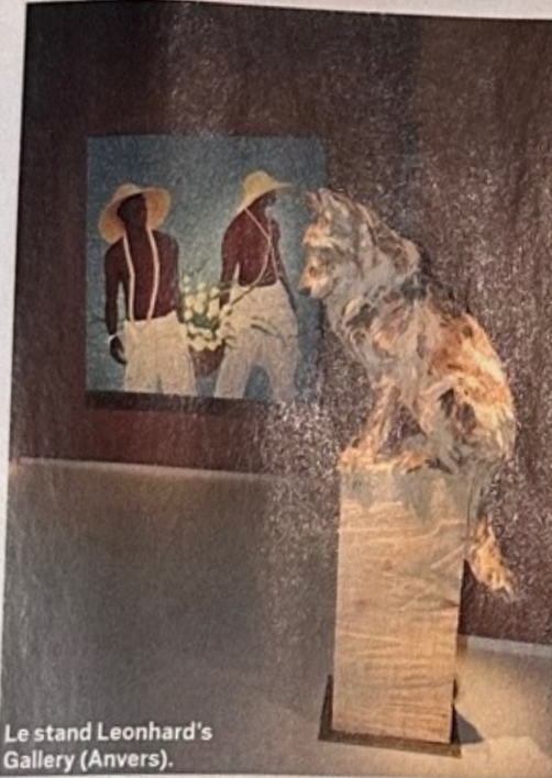
Le stand Leonhard's Gallery (Anvers).