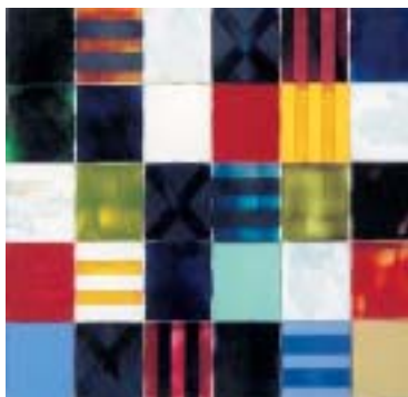
Matthew Johnson, Sans titre (boîtiers de CD et acrylique). A la manière d'un maître-verrier, l'artiste a ici travaillé sur la matière, les couleurs et la transparence pour suggérer la luminosité australienne en recourant à un support contemporain.