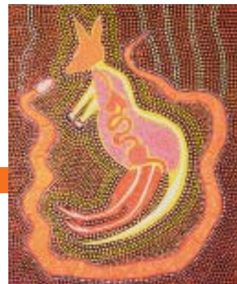
Gary Daniels, Kangourou et serpent (acrylique sur carton), inspirés des peintures sur écorce du Nord du pays où les sujets sont comme vus "au rayon X".