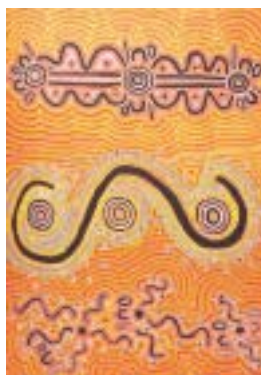
Mona Poulson et Douglas Marshall, Le rêve de l'opossum (acrylique sur toile), cartographie mythique des sites fondés au Temps du Rêve par les Grands Ancêtres Opossums.